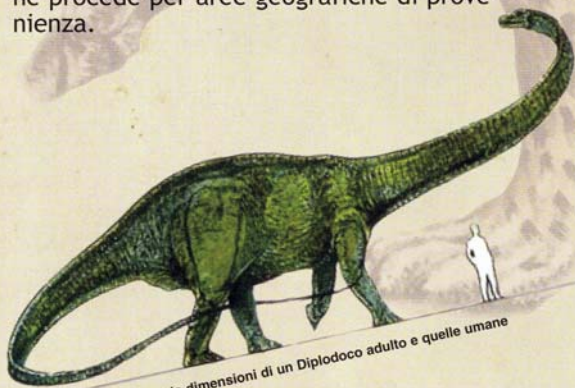
Rapporto tra le dimensioni di un Diplodoco adulto e quelle umane